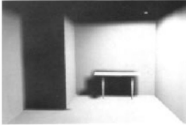
FIG. 1: Figure pour la question 5.