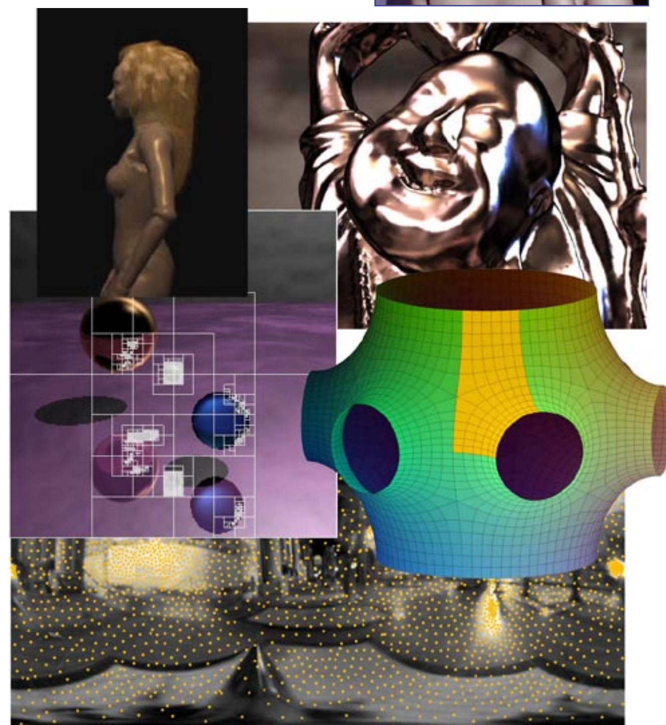
Images récentes produites au DIRO