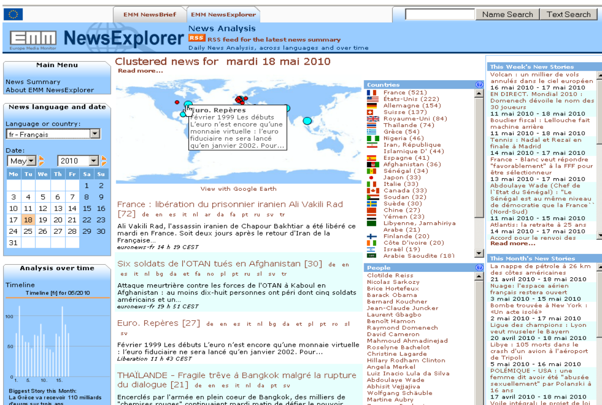
Figure 1 : L'environnement EMM