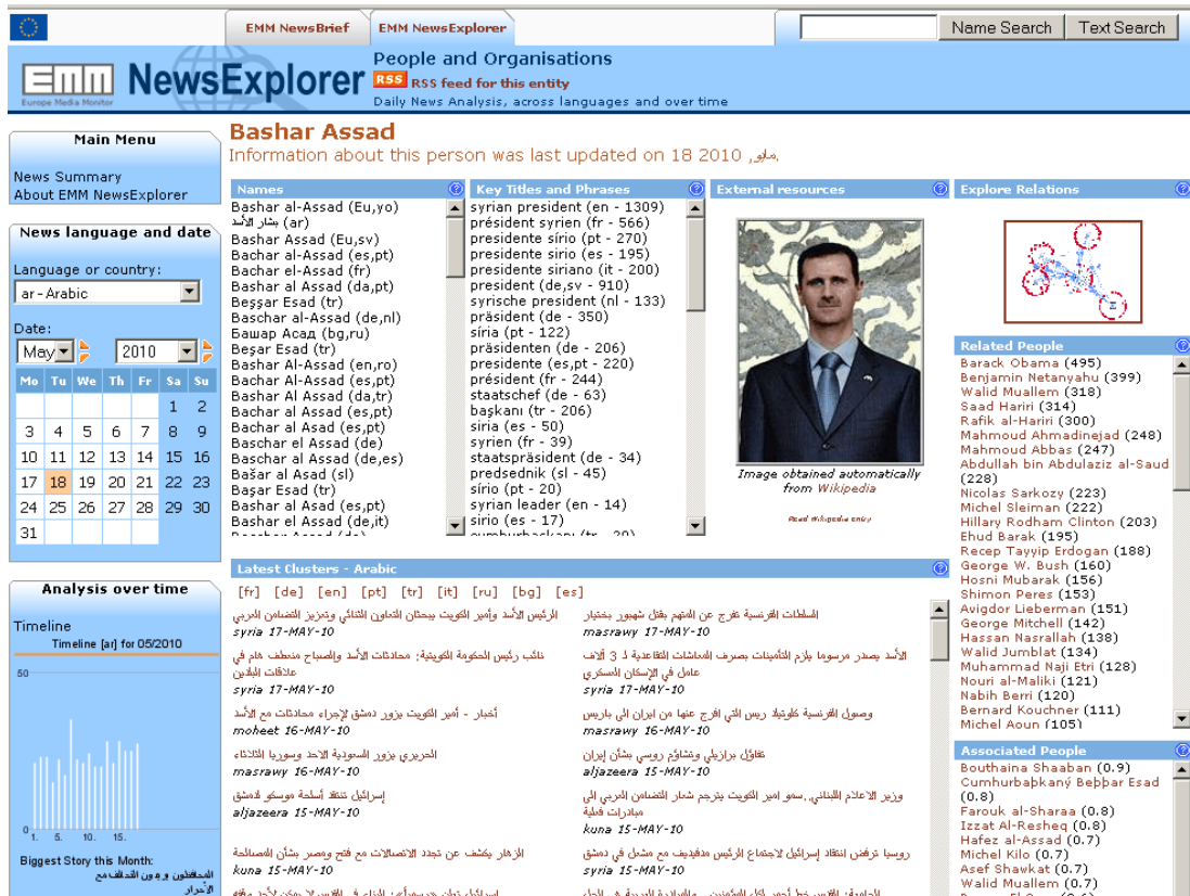
Figure 4 : Illustration d'un exemple d'entité nommée