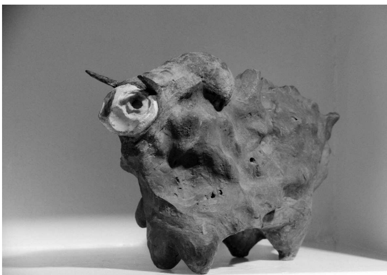
FIG. 11 – Une sculpture de CB

Enfant, on rêve. Adolescent, on fantasme. Adulte, on meurt ... sauf si on continue à rêver et à réaliser ses rêves. En mathématiques, en littérature (potentielle ou non), en peinture, en sculpture, en musique, le rêve fait partie du métier. L'enfant reste et il nourrit l'adulte, qui, en renvoi d'ascenseur, conseille l'enfant sur les songes trop dangereux, en espérant que parfois l'enfant ne suive pas les conseils.