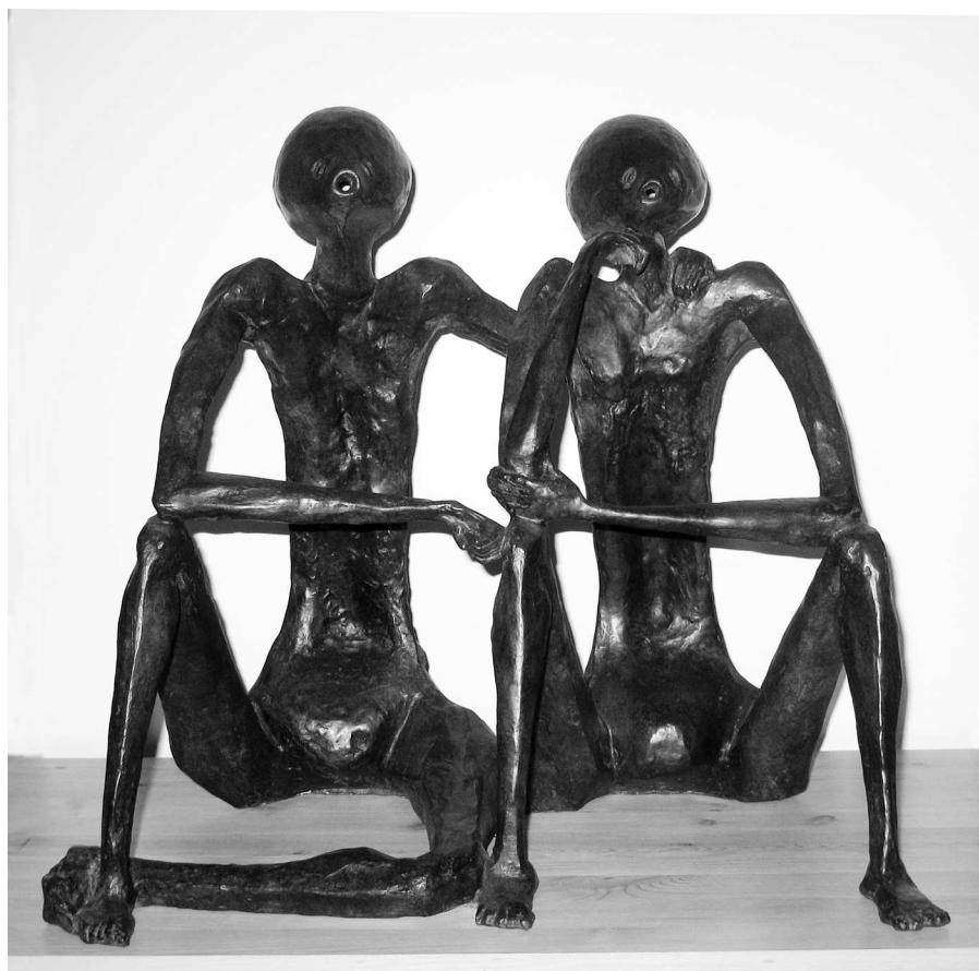
FIG. 8 – Les Clones

Il y en a même une qui est perdue depuis des années. Pourtant il y en avait ! D'abord les sculptures multipètres [5], des collages magnifiques de pierres et de coquillages d'inspiration, disons, ancestrale. Puis un silence artistique après la mort de son fils. Et un renouveau, commençant, peut-être, avec une petite rétrospective à la Galerie Adrian Bondy en 1990, figure 7 (voir aussi [8], l'avant-dernière photo). Les dernières sculptures pourraient s'appeller duchampètres , elles sont construites à la campagne à partir d'objets fermiers (voir [8], la dernière photo). Entre les deux, il y a eu également quelques bronzes, dont les magnifiques Clones , figure 8, un couple magique fumeur de cigarettes (il suffit de leur en allumer une à chacun pour qu'ils les fument).