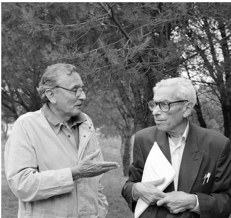
FIG. 1 – Claude Berge et Paul Erdős, 1995