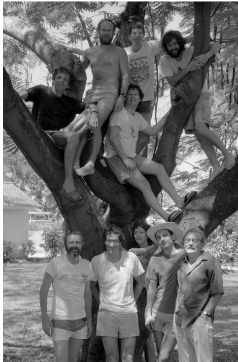
FIG. 5 – Mathématiciens à la Barbade

Autour d'une grande table les chaises sont tassées, il ne reste presque plus de place. Au tableau, un Canadien - ou, peut-être, un Américain ou un Slovaque - parle des graphes, en français approximatif truffé d'anglais. Les étudiants, chercheurs, visiteurs, plongent dans l'exposé même si certains pensent plutôt à l'heure car, à la sortie, il faudra courir chez Poilâne (la queue!) puis à la gare quand on vient de loin (Orsay, Le Mans). Finalement, les questions, presque hésitantes, de Claude. En anglais, cela facilite la vie. Pertinentes.