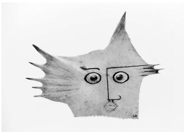
FIG. 9 – Une sculpture de CB

Ce que les sculptures de Claude partagent avec les mathématiques, c'est la création d'objets nouveaux, d'idées nouvelles, à partir d'une collection à priori très disparate, au départ par jeu, mais à la fin et au fond par un procédé réfléchi et très sérieux. Il suffit de regarder ces masques de coquillages – rien à voir avec le kitch que l'on peut acheter près des plages presque partout au monde. Il y a toujours le jeu, la sensualité, la sexualité, et la timidité.