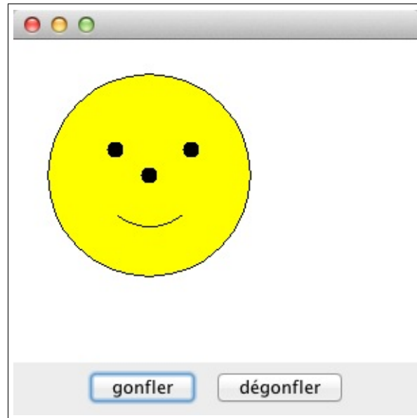
Figure 2: Application de gonflage de Face