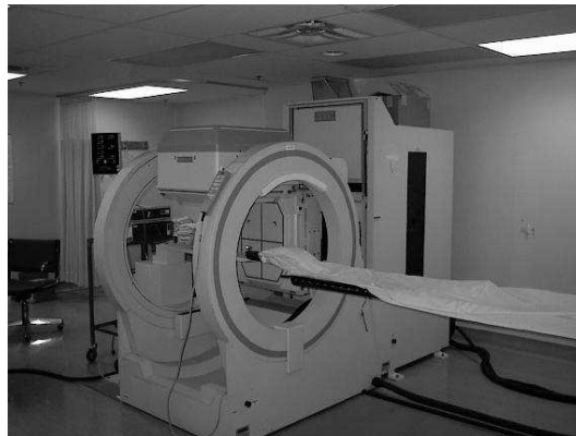
FIG. 1 – Image d'un tomographe.

L'objet de ce TP est de réaliser dans un premier temps la simulation d'un tomographe axiale (cf. Figure 1) puis dans un deuxième temps de retrouver l'image originale par reconstruction tomographique. La tomographie se rencontre en particulier en médecine où on doit retrouver une tranche (i.e., une image) d'un organe (le cerveau par exemple) à partir de ses projections obtenues par Rayons-X. On utilise une approche semblable en mécanique et métallurgie pour effectuer des essais non-destructifs (i.e., sans aucun contact avec la pièce à étudier) ou encore en géologie et géophysique pour étudier les différentes couches géologiques d'un terrain etc.